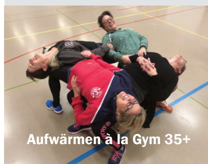
Aufwärmen à la Gym 35+